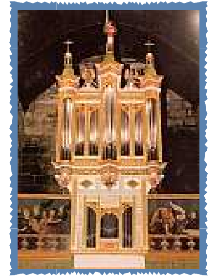
St Guinal d'Ergué-gabéric

Depuis 7 ans, l'Académie Internationale de Musique en Cornouaille