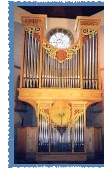
St Pierre de Fouesnant